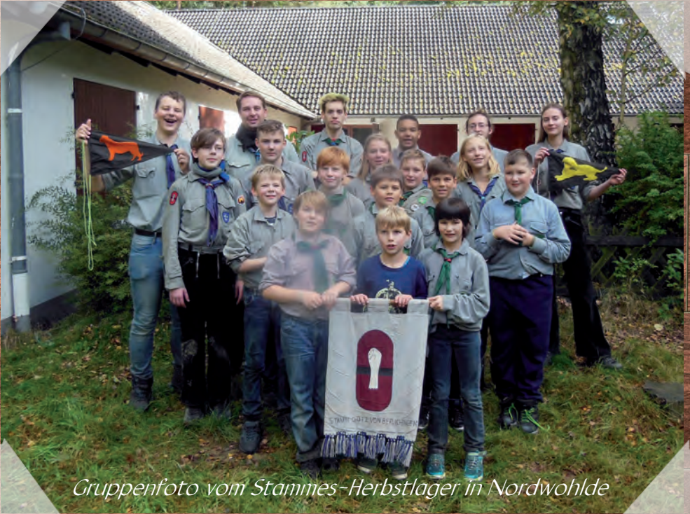
Gruppenfoto vom Stammes-Herbstlager in Nordwohldede